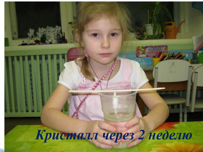
Кристалл через 2 неделю