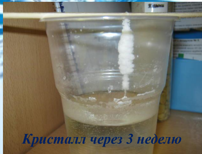
Кристалл через 3 неделю