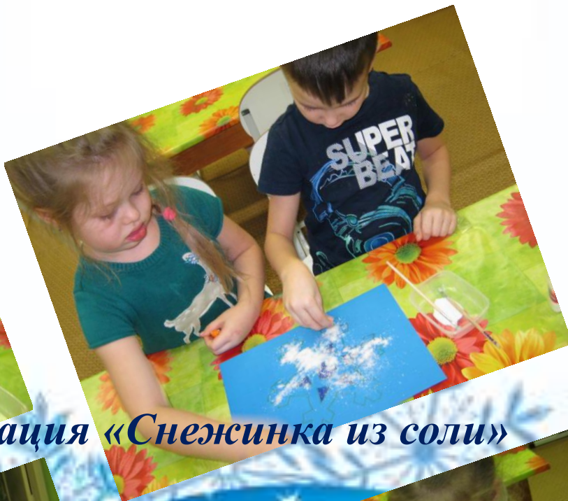
Аппликация «Снежинка из соли»