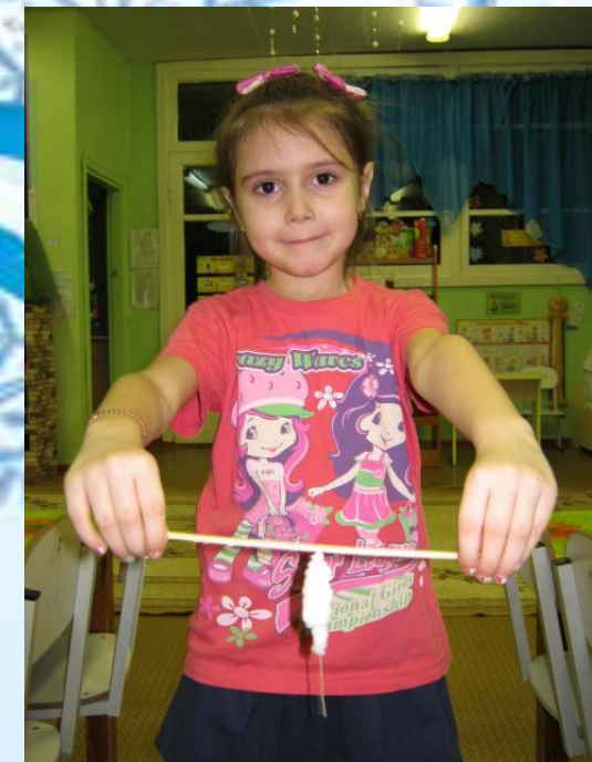
Кристалл через 4 неделю