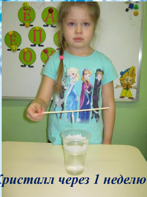
Кристалл через 1 неделю