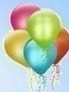
Пять воздушных шаров